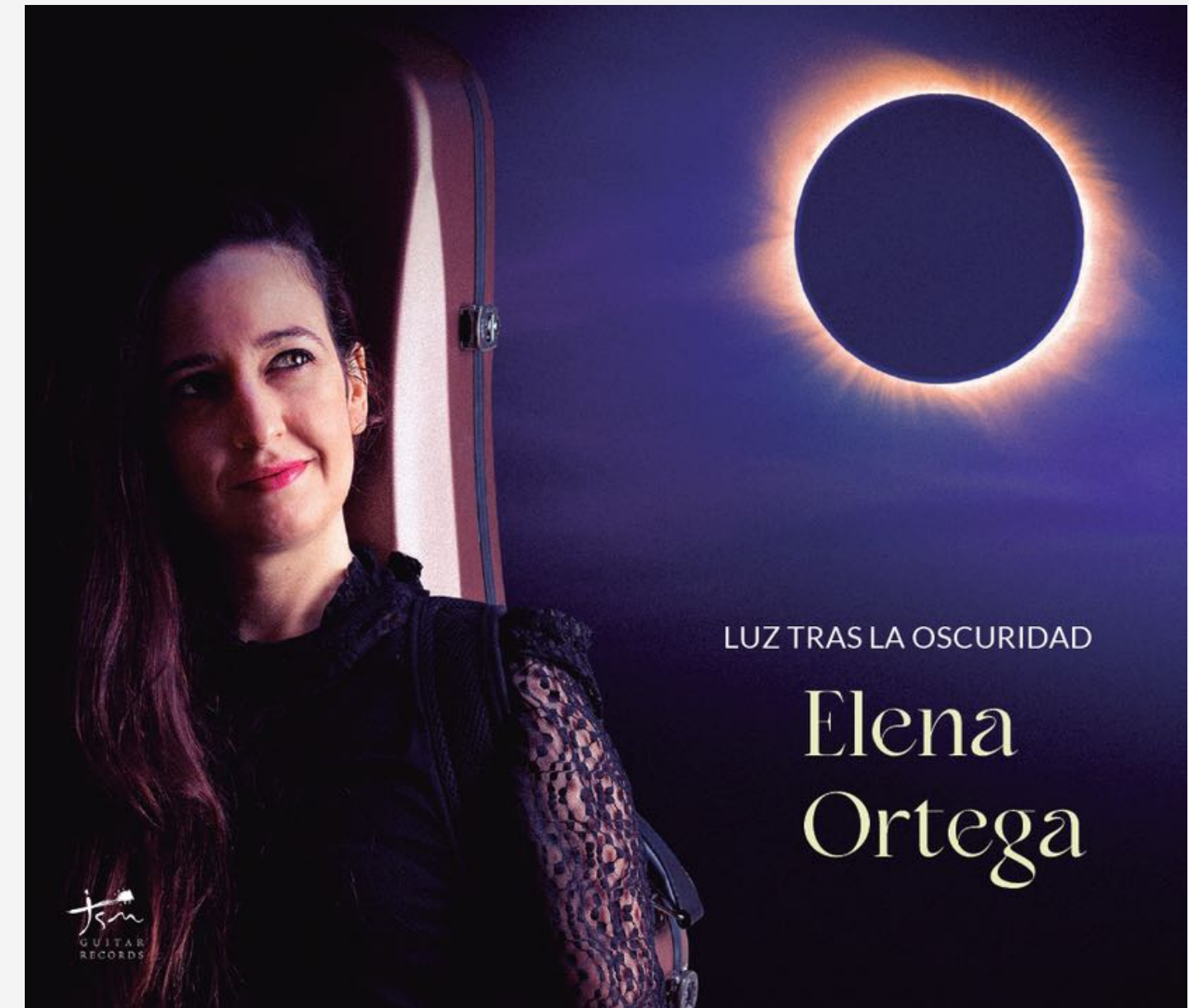
Luz tras la Oscuridad, 2024