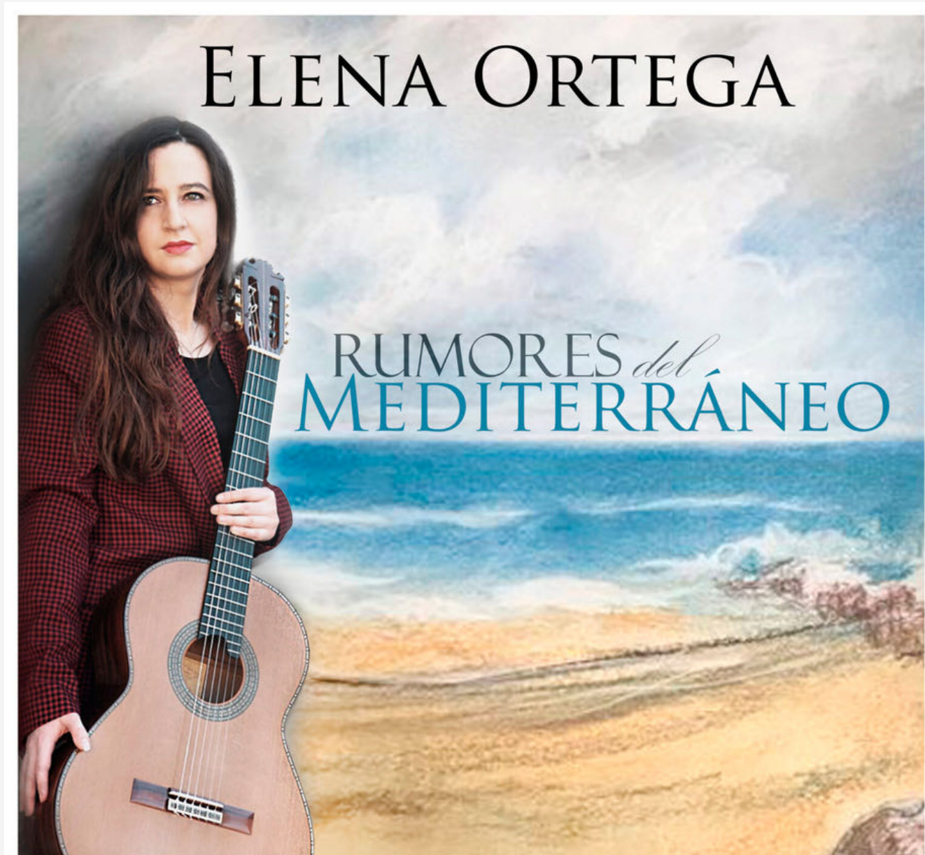
Rumores del Mediterráneo, 2022